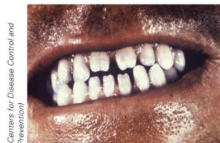
(Centers for Disease Control and Prevention)